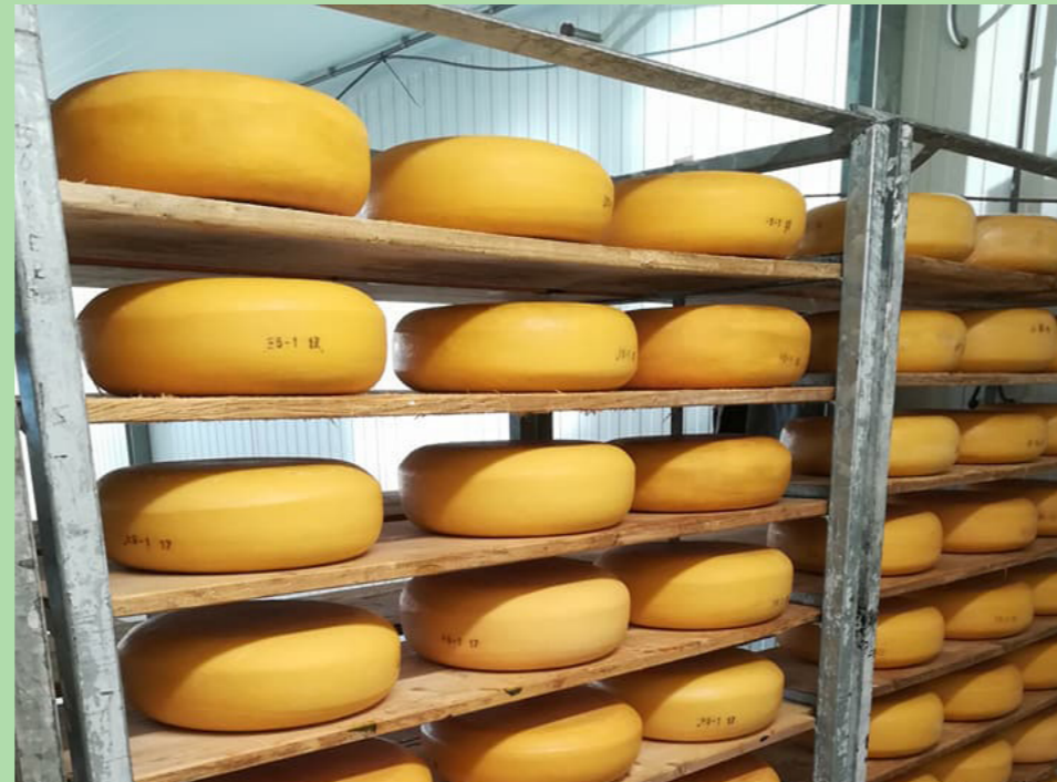
Eko-Boerderij 'De Eerste'