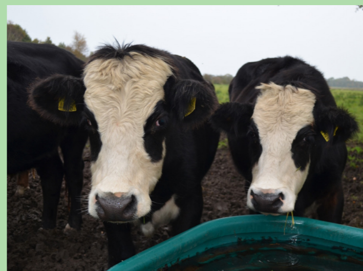
Welkomboerderij Onstaheerd Sauwerd