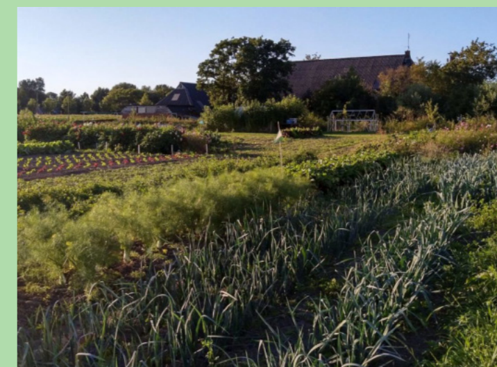
Tuinderij Klein Alma