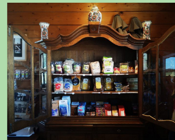
Boerderij De Boterbloem