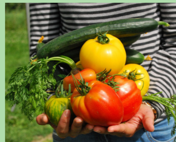
Fruittuin van West