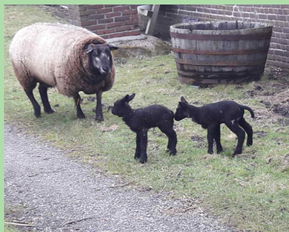
Zorgboerderij De Straalhoeve

In ongeveer 1,5 uur tijd (zonder pauzes) kom je langs prachtige polders en landerijen tussen Amsterdam en Haarlem. Onderweg fiets je langs 5 verschillende aanbieders waar je kunt genieten van de verse producten die zij ter plekke aanbieden. Stap dus gerust af en bezoek Zorgboerderij de Straalhoeve, Bakkerij Mama, Fruittuin van West en/of de Stadsgroenteboer. Stuk voor stuk verkopen ze heerlijke producten: verse sapjes, ambachtelijk gebakken brood, groente, fruit en zelfs een bos bloemen. Houd je ook van wandelen? Dan kun je je hart ophalen. Zet je fiets aan de kant en maak bijvoorbeeld een wandeling in het park van Zwanenburg. Bij uitstek een fietsroute voor de sportieveling die van lekker eten houdt!