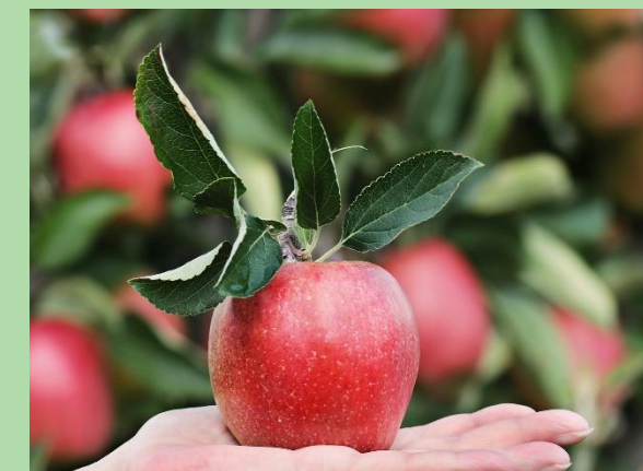
Landgoed De Olmenhorst