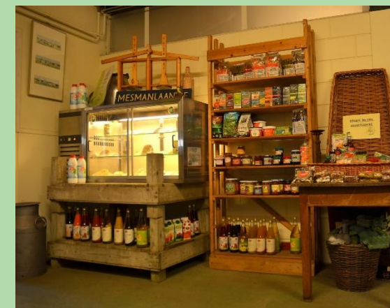
Tuinbouwbedrijf De Landyn