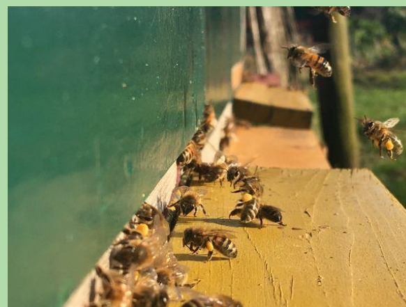
Imkerij: In de buitenlucht