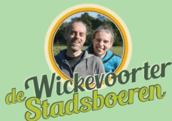
De Wickevoorter Stadsboeren