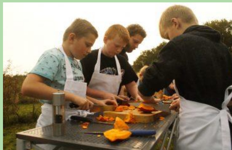
Tuinen van Weldadigheid