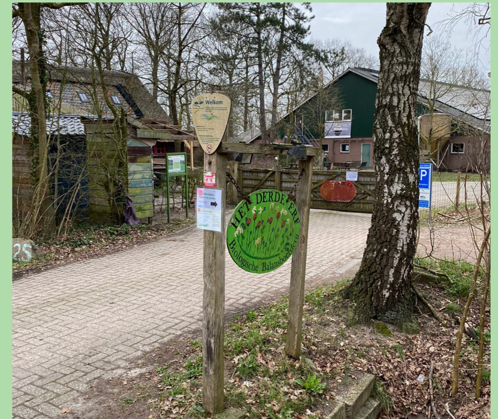
Het Derde Erf