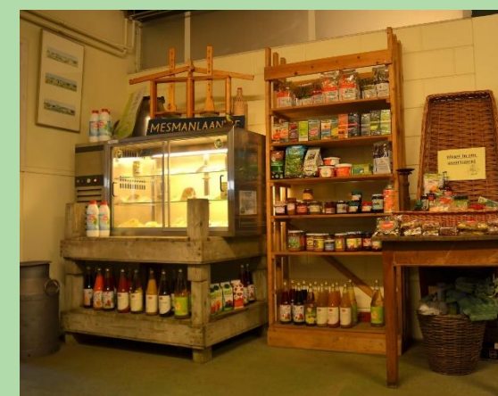
Tuinbouwbedrijf De Landyn